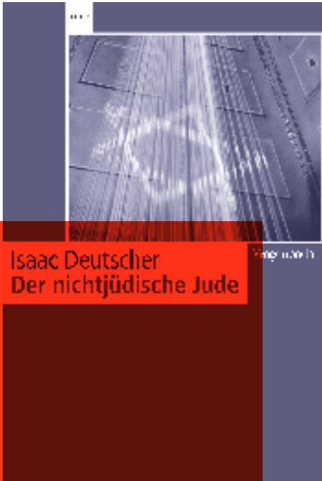
Cover der 2023 bei Wagenbach erschienenen Neuauflage von «Der nichtjüdische Jude»

Die Notwendigkeit des Sturzes des Kapitalismus blieb für Deutscher der unverrückbare Maßstab zur Beurteilung der Revolution von 1917, auch unter Berücksichtigung des von Stalin zu verantwortenden Abkommens von ihrem Weg. Manche Urteile Deutschers riefen allerdings auch heftige Kritik hervor – nicht nur von Antikommunist*innen, für die er natürlich nur ein besonders raffinierter Apologet war. Auch aufseiten der Linken, insbesondere bei seinen ehemaligen trotzkistischen Genoss*innen, handelte er sich scharfe, zum Teil überzogene Kritik ein. Denn er knüpfte insbesondere ab 1953 große Hoffnungen an das Aufbrechen stalinistischer Strukturen und versprach sich weitgehende Selbstreformen der Partei- und Staatsbürokratie. Dass diese Prozesse jedoch immer wieder mit heftigen Rückschlägen verbunden waren, nicht zuletzt in seiner alten Heimat Polen, in die er ab 1956 zunächst große Erwartungen gesetzt hatte, musste er allerdings schon bald konstatieren. Nur zwei Jahre nach dem Sturz von Nikita Chruschtschow starb er selbst und konnte so nicht mehr erleben – und auch nicht beurteilen –, was dann folgte: die Niederschlagung der Aufbruchsversuche des Jahres 1968 gerade auch in Osteuropa, der anschließende langsame, aber nicht zu übersehende Verfall des gesamten «realsozialistischen» Lagers und der Kollaps 1989/90.