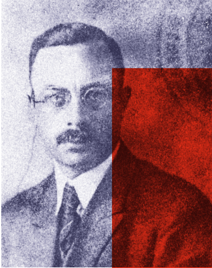
August Thalheimer, um 1933

schaft der Freiheit und Gleichheit, den Sozialismus – stand nicht nur im Gegensatz zur Politik der KPD, sondern stellte auch eine Herausforderung für die zweite große Arbeiterpartei, die SPD, dar. Die Gründe für den Misserfolg der KPDO sind eng mit den Ursachen für den Untergang der Republik von Weimar und die Kapitulation der deutschen Arbeiterbewegung vor dem Faschismus 1933 verbunden.