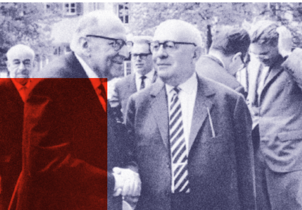
Max Horkheimer und Theodor W. Adorno im April 1964 in Heidelberg, rechts im Hintergrund Jürgen Habermas

und Leo Löwenthal um 1920, zionistisch engagierten. Sowohl der biografische Hintergrund ihrer Vertreter*innen als auch der institutionelle Horizont der Kritischen Theorie sind entscheidend vom modernen Antisemitismus, der Erfahrung des Exils und der Reflexion der Shoah geprägt. Davon ausgehend entwickelten Horkheimer und