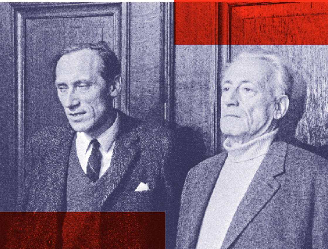
Leszek Kołakowski (links) und Henri Lefebvre im März 1971 in Amsterdam