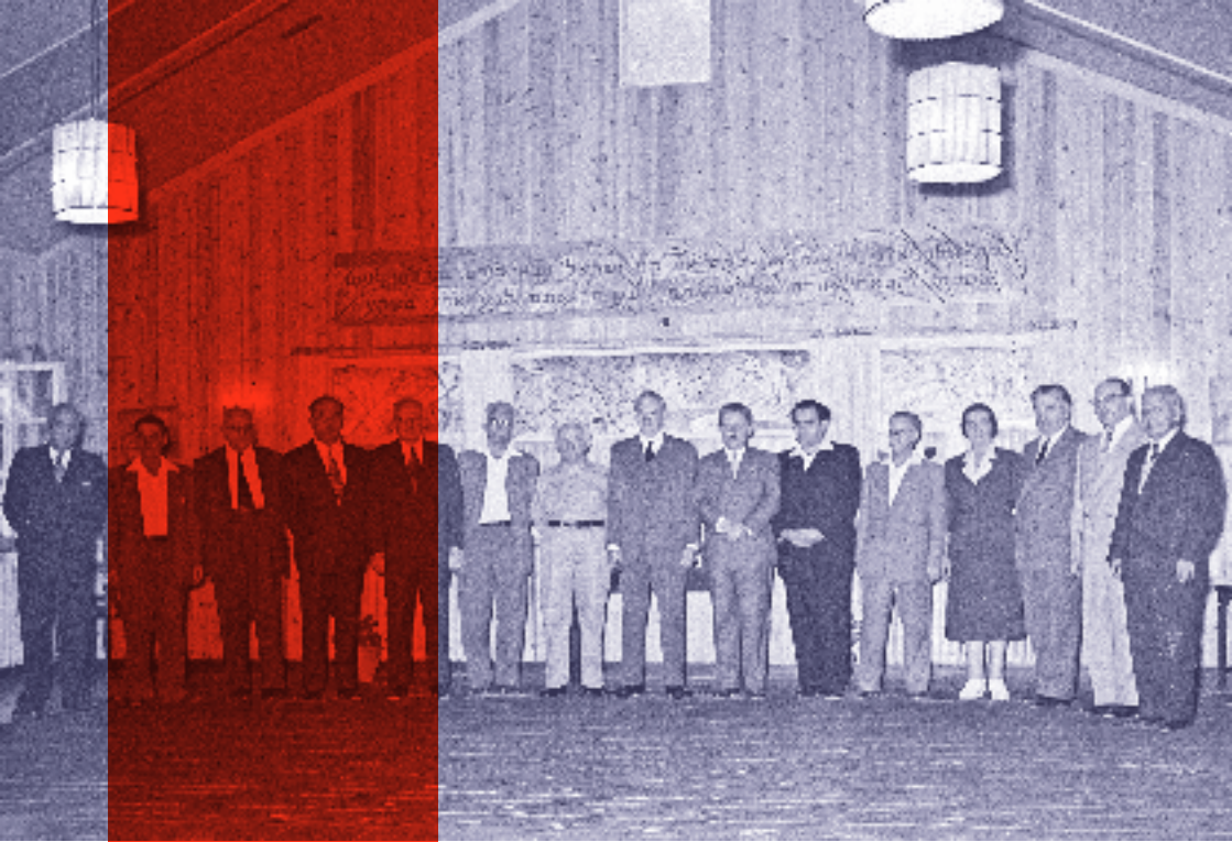
Das neue israelische Kabinett, November 1955, mit Fritz Perez Naphtali (2. von links)

NAPHTALIS ANSPRUCH 1929 WAR ES, DIE JÜDISCH-NATIONALE UND DIE KLASSENFRAGE IM RAHMEN EINES ZIONISTISCH GEPRÄGTEN GEMEINWESENS ZU LÖSEN.