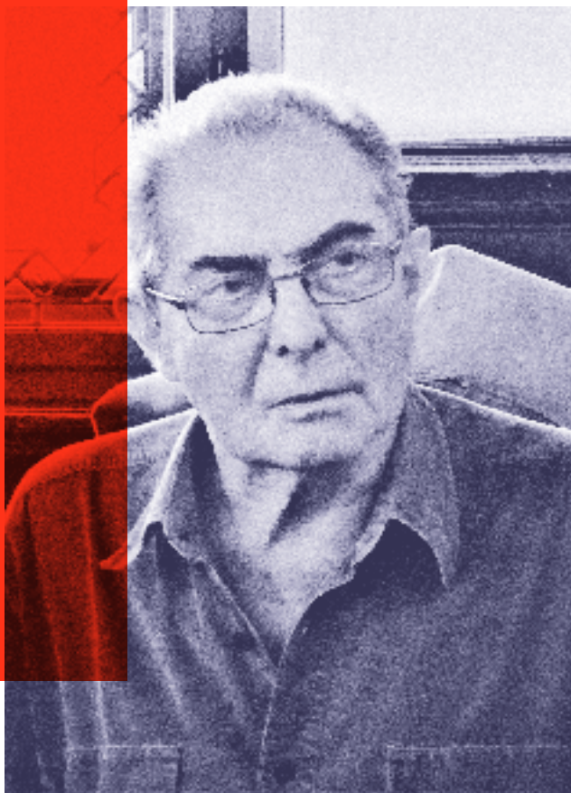
Karol Modzelewski beim «Festiwal Góry Literaturny», Juli 2017, das seit 2015 in Polen in Nowa Ruda und in der Umgebung stattfindet

war er einer der führenden Intellektuellen in der Solidarność-Bewegung, auf ihn geht der Name der Gewerkschaft zurück, ein symbolischer Brückenschlag hin zu den Anfängen der modernen polnischen Arbeiterbewegung im letzten Jahrzehnt des 19. Jahrhunderts. Am 13. Dezember 1981, dem Tag der Verhängung des Kriegsrechts,