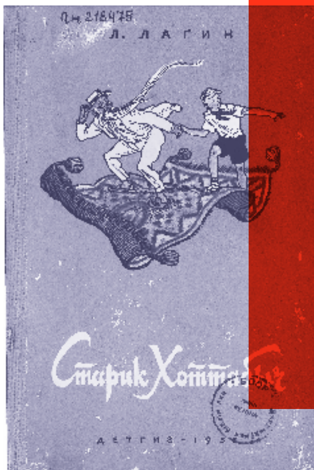
Cover der Ausgabe von Lagins «Starik Chottabyč» von 1955