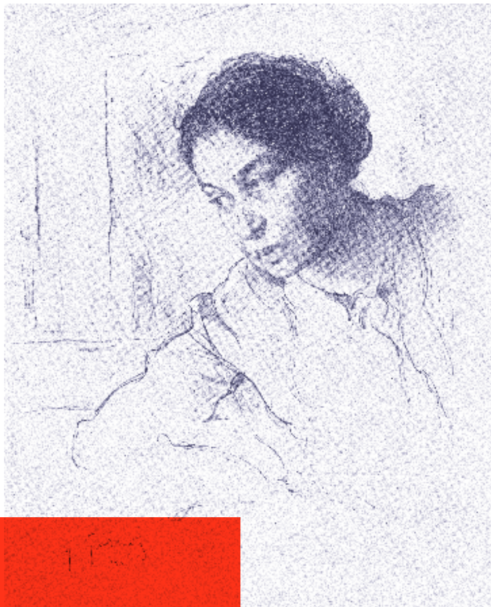
Zeichnung von Isaak Brodsky: Angelica Balabanoff auf dem zweiten Kongress der Kommunistischen Internationale, 1920