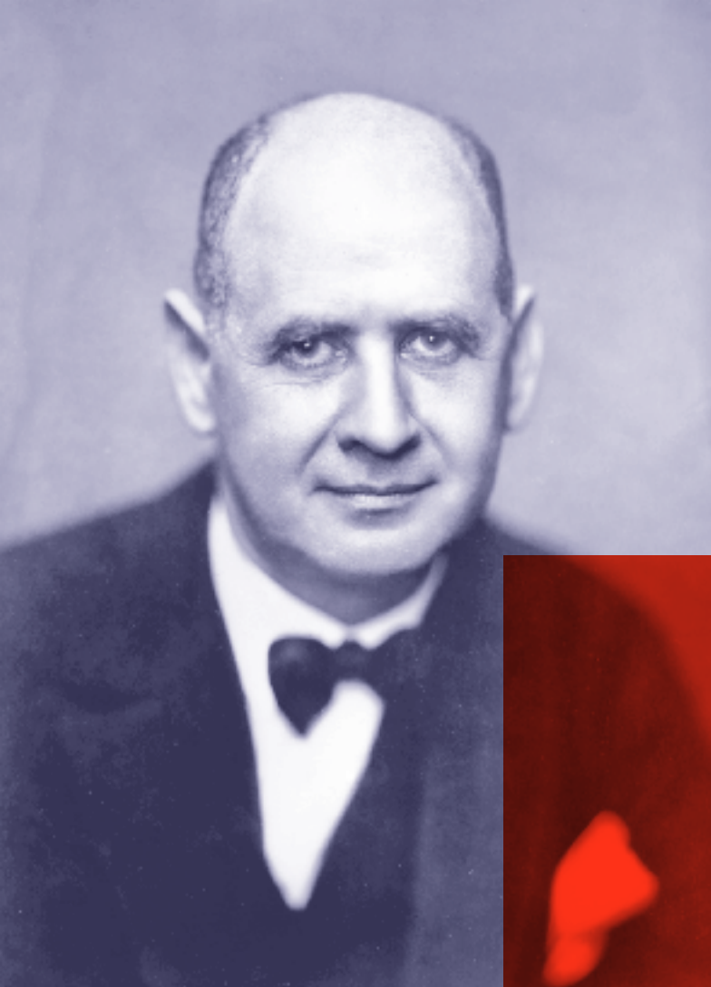
Paul Levi, Ende der 1920er-Jahre

PAUL LEVI SUCHTE IN POLITISCHEN PROZESSEN IMMER WIEDER, GERECHTIGKEIT MIT RECHT ZU ERSTREITEN.